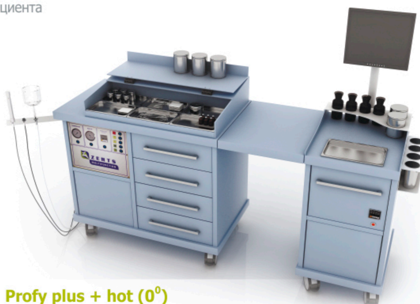
Profy plus + hot (0°)