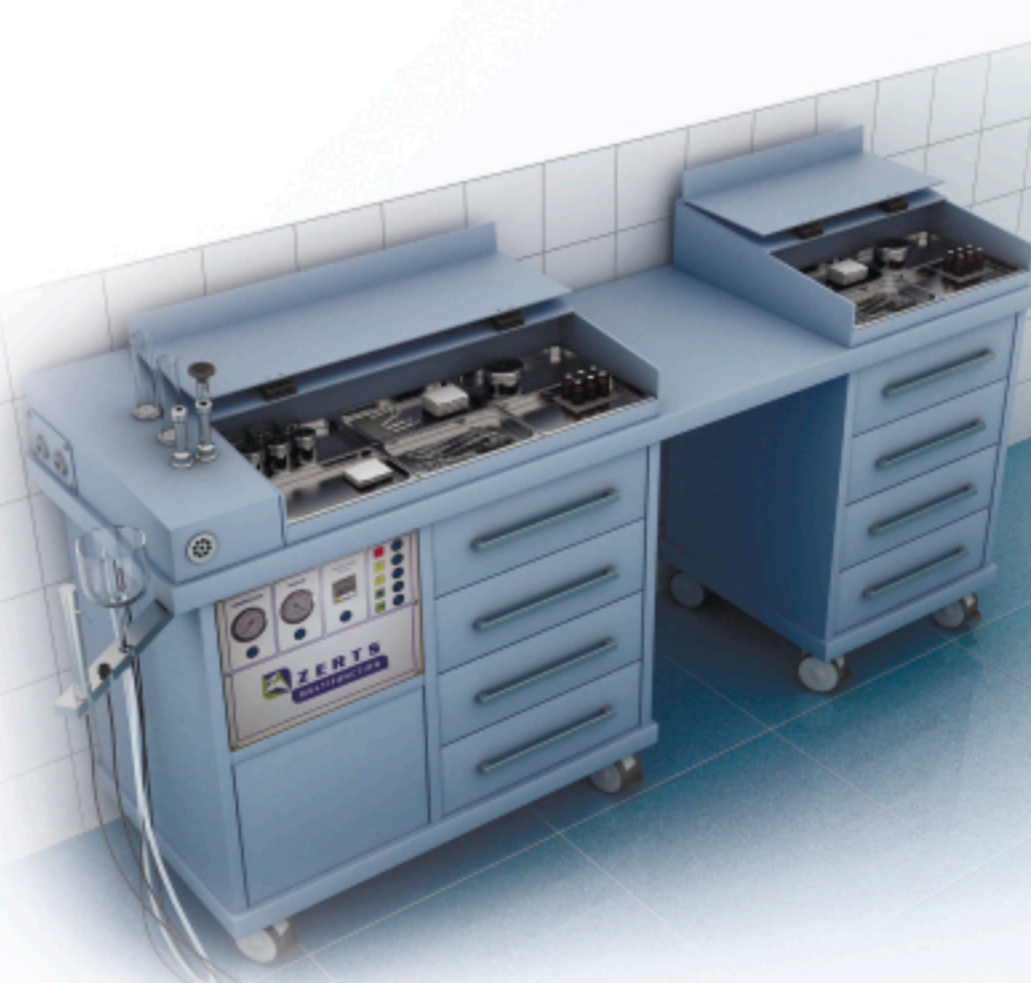
Expert plus + mobil (0°)