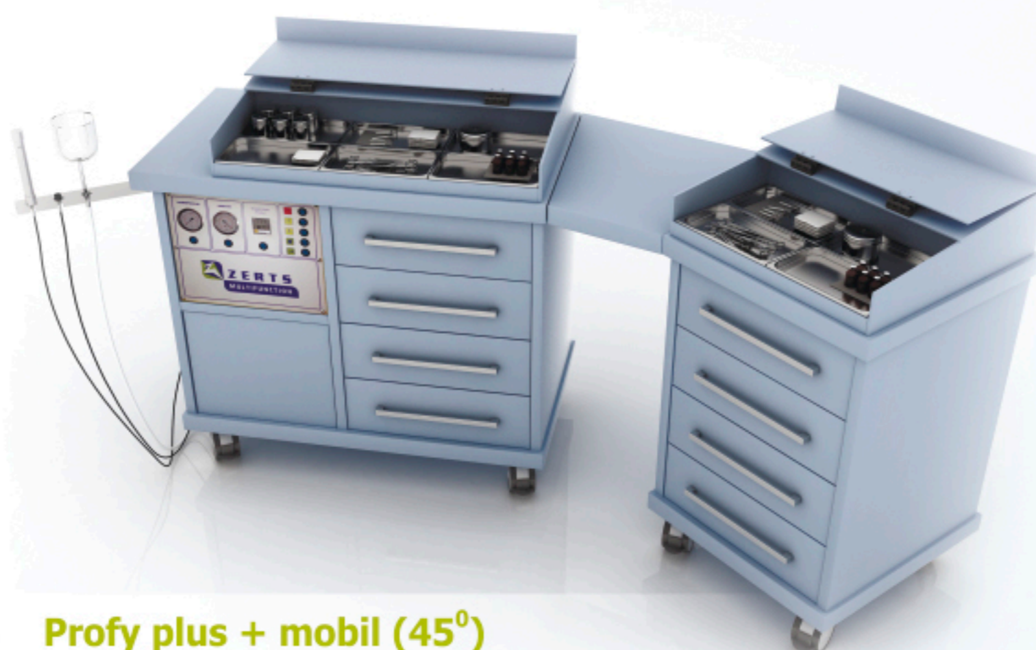
Profy plus + mobil (45°)