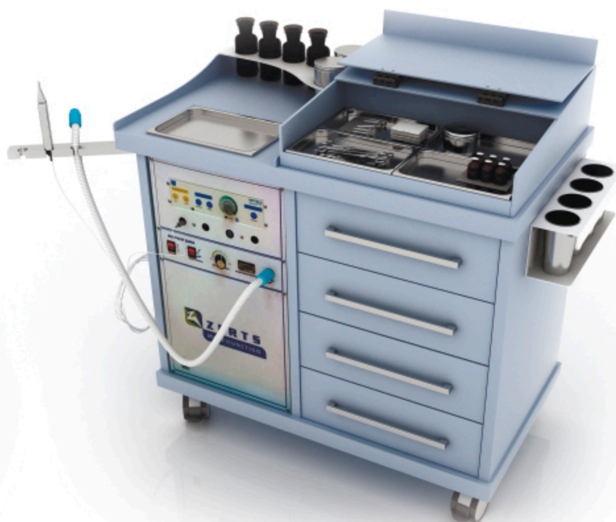
Energy plus 1100x590x1070 мм