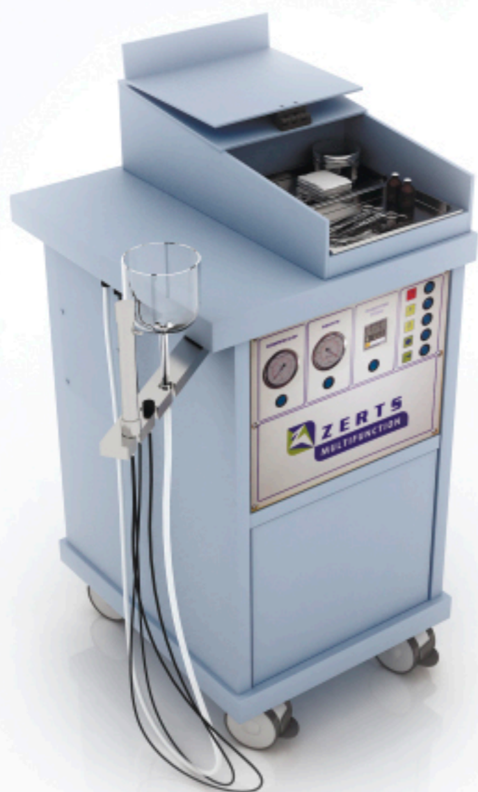
Profy 510x590x1070 мм