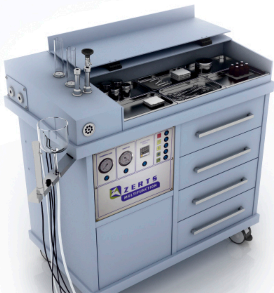
Expert plus 1100x590x1070 мм