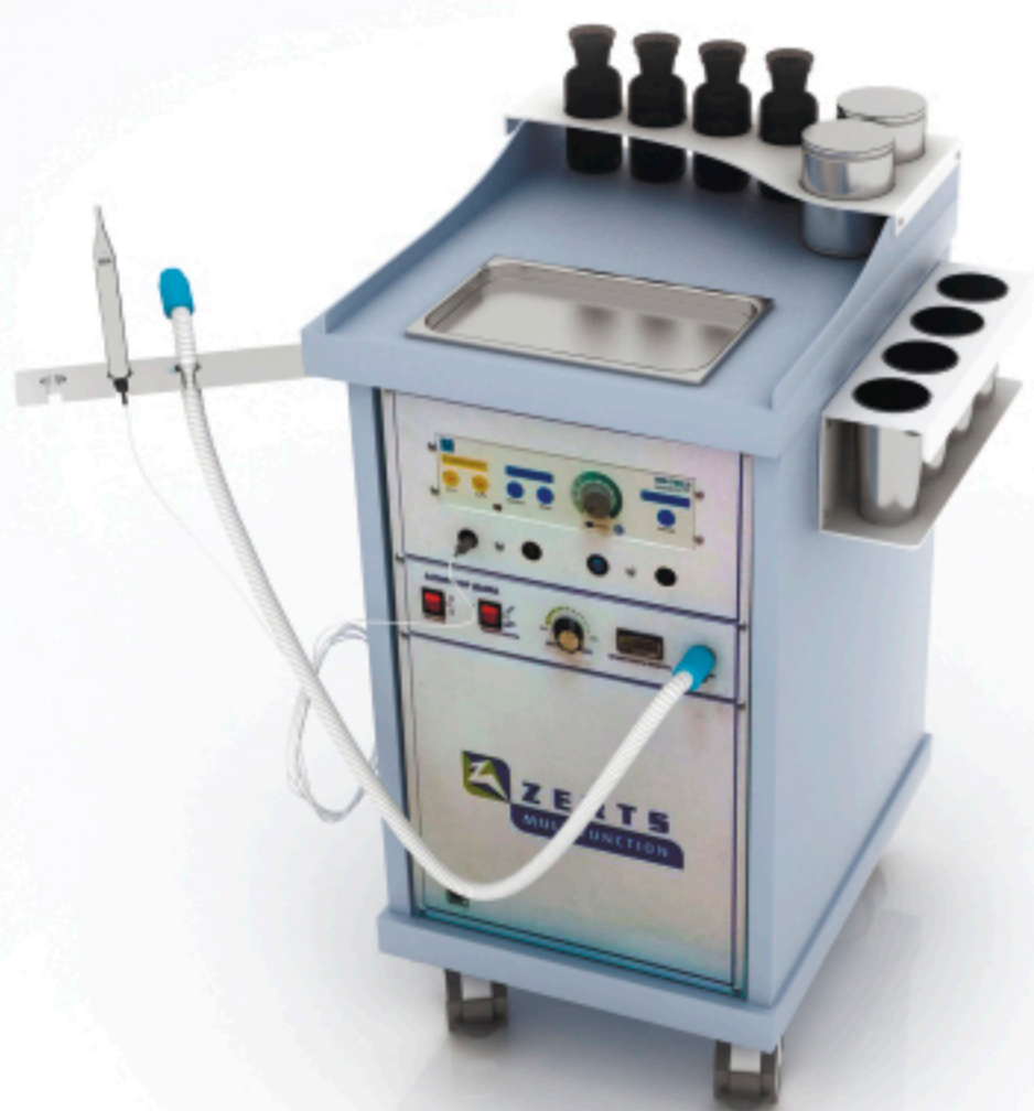
Energy 510x590x1070 мм