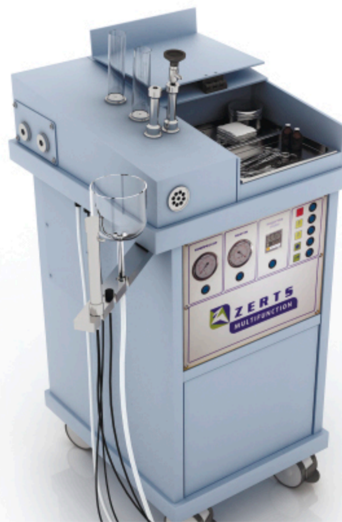
Expert 510x590x1070 мм