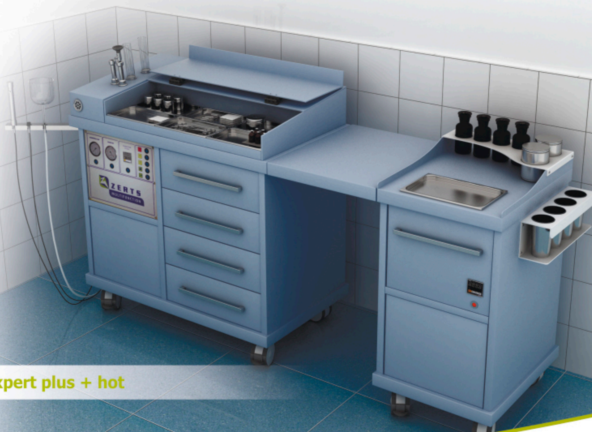
Expert plus + hot