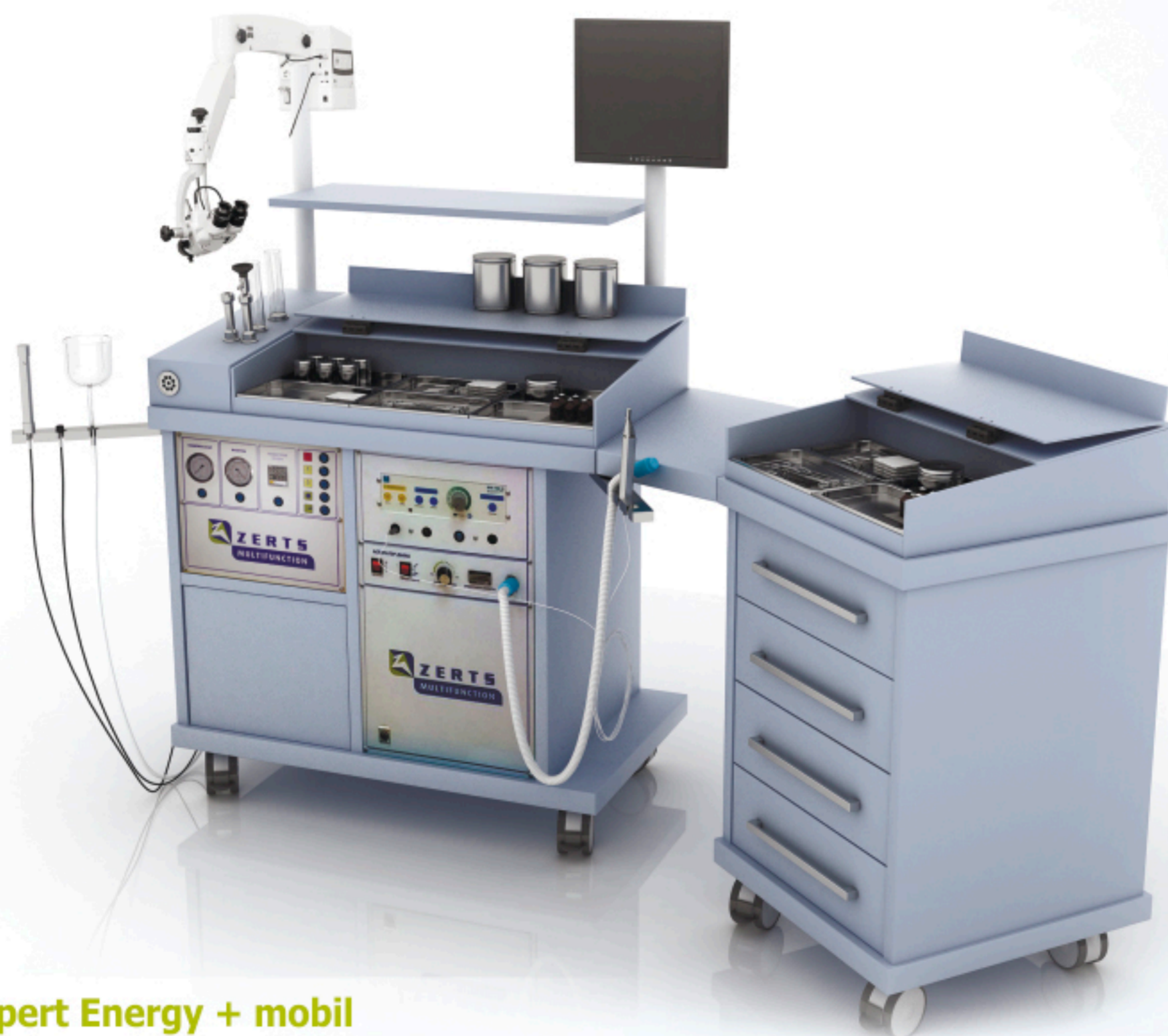
Expert Energy + mobil