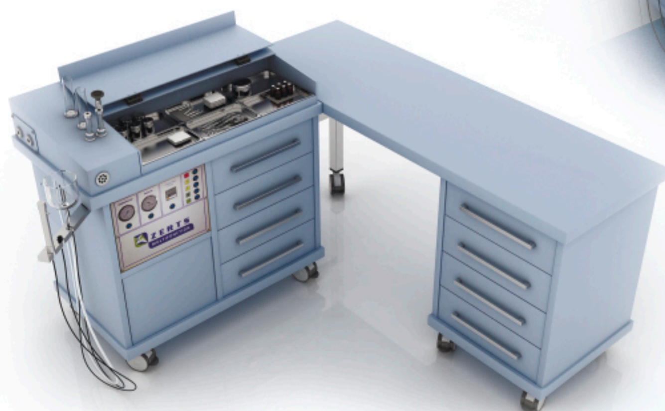
Expert plus + mobil (90°)