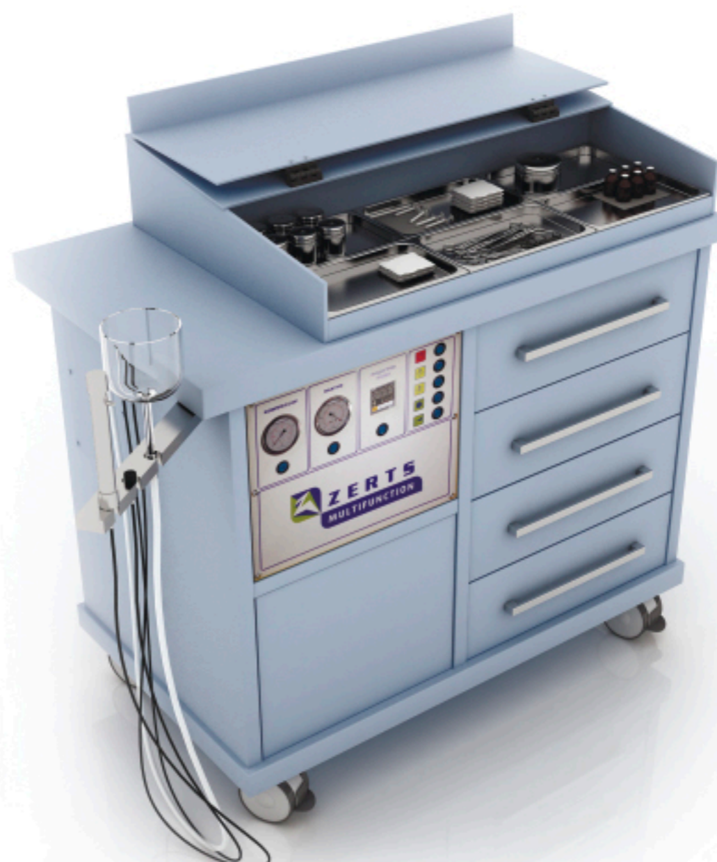
Profy plus 1100x590x1070 мм