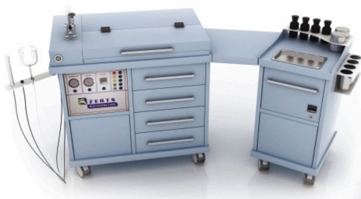
Expert plus + hot (45°)

Составьте свой комплект модулей и блоков, мы соединим их в единый комплекс